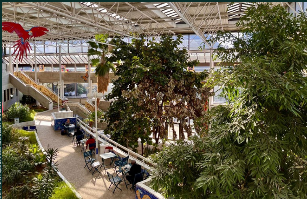
Jardin d'hiver de l'Hôpital universitaire Robert-Debré

Présentation des recherches et projets Master et post-doctorat